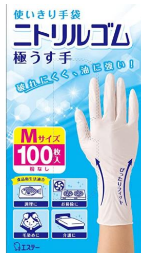
[ニトリルゴム手袋例]