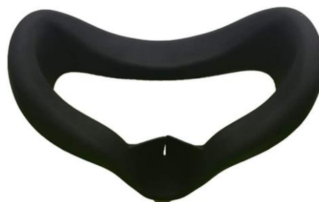
[シリコン製カバー]