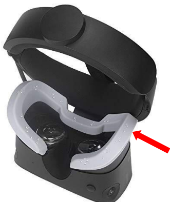
【シリコン製カバー】