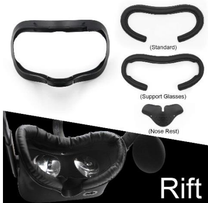
[非純正フェイスパッド]