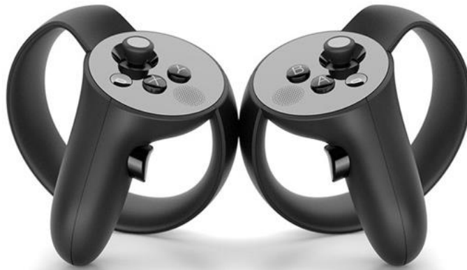
[旧型ゴーグル(Oculus Rift cv1)用コントローラー]