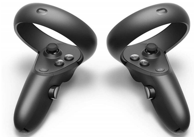
[新型ゴーグル(Oculus Rift S)用コントローラー]