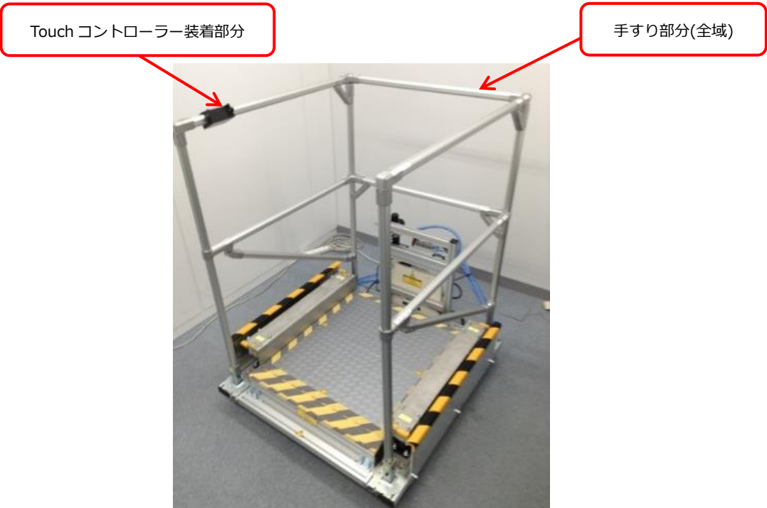
[床落下装置 RiMM SH-03A]