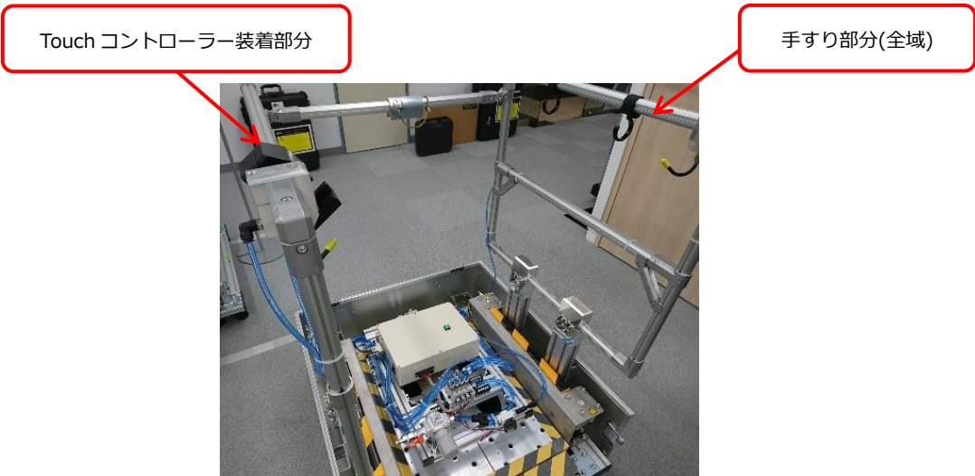
[モバイル低床動揺装置Ⅱ型 RiMM SH-22]